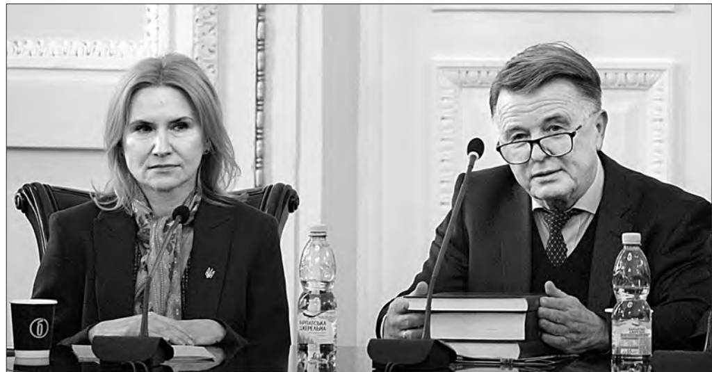
Заступниця Голови Верховної Ради України Олена Кондратюк, ректор Львівського національного університету імені Івана Франка Володимир Мельник.

У межах робочої поїздки до Львова Заступниця Голови Верховної Ради України Олена Кондратюк провела розмову-лекцію зі студентами політологами, істориками та міжнародниками Львівського національного університету імені Івана Франка.